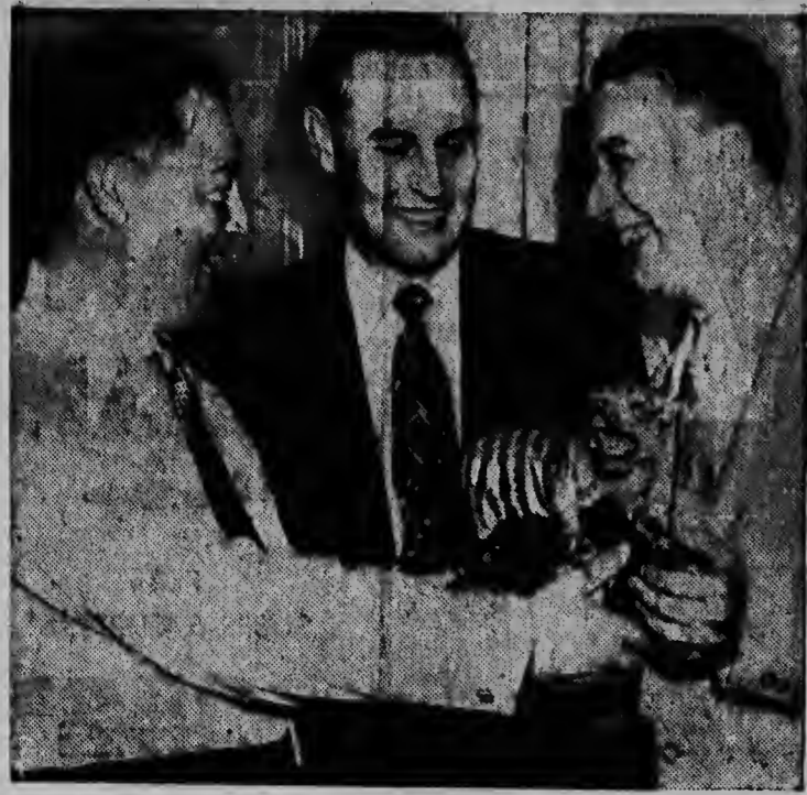
Tur hende ta contento den e ceremonia aki na Detroit na e momento cu e propietario anterior di Tigers Spike Briggs ta entrega e tiger na un di e propietarios nobo...